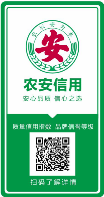
图 6 竖排样式