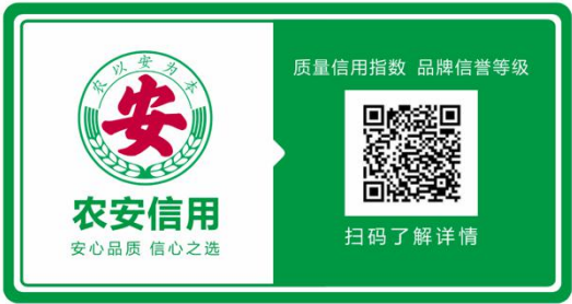
图 7 横排样式