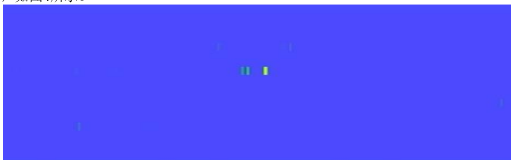
图4 坑洞损伤轨顶面漏磁检测颜色图谱

坑洞对应轨顶面位置的多通道颜色局部集中突变：坑洞引发轨顶面局部磁路突变，各检测通道在坑洞区域出现点状或块状高亮异色区，异常色块边界清晰、范围集中，多通道间异常位置高度重合，与坑洞轮廓匹配，如图4所示。