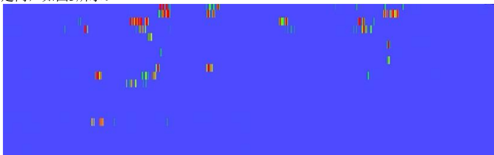
图3 锈蚀损伤轨顶面漏磁检测颜色图谱

锈蚀对应轨顶面位置的多通道颜色局部弥散异常：锈蚀造成轨顶面表层磁导率不均，各检测通道在锈蚀区域呈现区域性模糊色斑，异常色块呈弥散状分布、边界柔和，多通道间异常位置对应但形态松散，无明显线性走向，如图3所示。