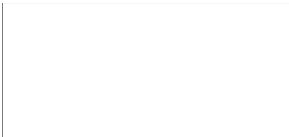
图 D.1 淀粉及淀粉制品产品各生命周期阶段碳排放分布图