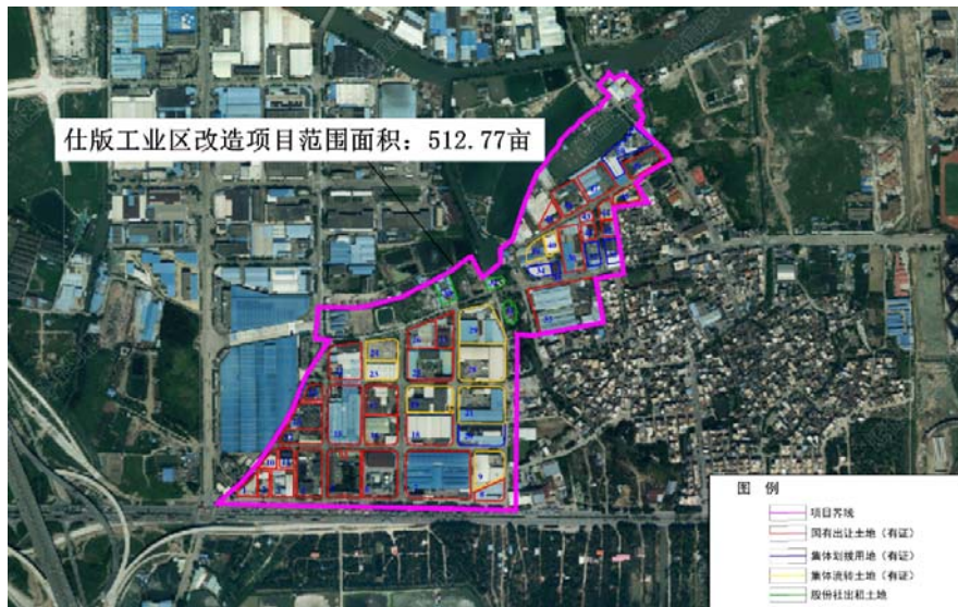
图B.1 伦教仕版工业区改造项目范围图

伦教仕版工业区位于伦教仕版村龙洲路以北、奋杨路两侧、均益路以南，紧靠佛山一环及325国道，总用地面积约折合513亩，其中属国有性质的197亩，集体性质的约317亩（含集体流转60亩）。园区产业以生产机械装备、五金、电器、家具为主，现状容积率约为0.8，改造迫切性高。项目规划工业用地247亩，商住用地96亩，道路、绿地等配套设施用地171亩。项目范围图见图B.1。