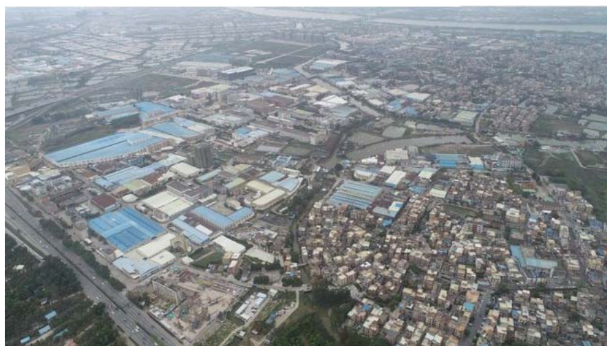
图B.2 伦教仕版工业区改造项目改造前示意图