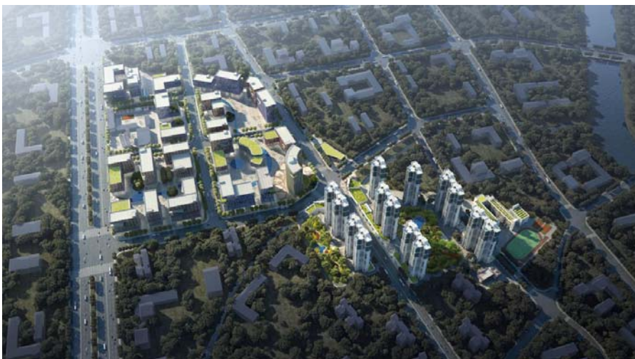
图B.3 伦教仕版工业区改造项目改造后示意图