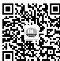
电力标准信息微信