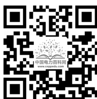
中国电力百科网网址