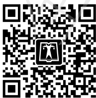
中国电力出版社官方微信