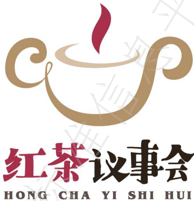
图 E.1 红茶议事会专用标志