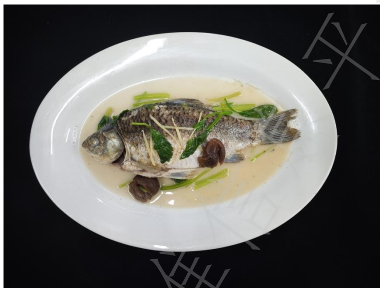
图 A.2 “梅汁鲫鱼” 成品图