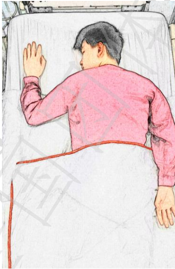
图 3. 俯卧位左侧翻身示意图