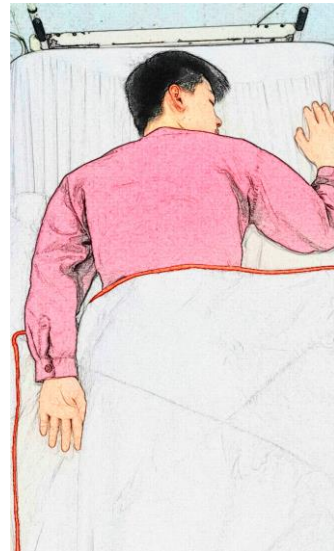
图 4. 俯卧位右侧翻身示意图