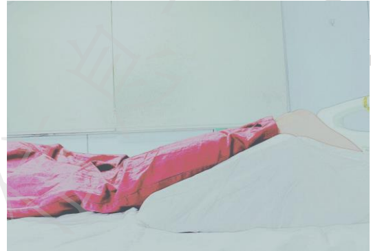
图 2. 俯卧位双下肢体位摆放示意图