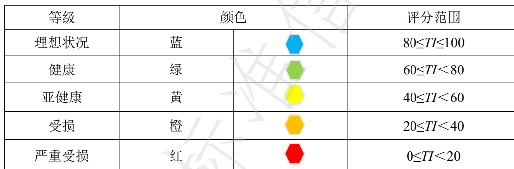
表9 城市河流生态健康评价分级表

7.2.2 城市河流水体生态健康等级根据评价指标综合赋值确定，采用百分制，城市河流健康等级、颜色分级和说明见表9。