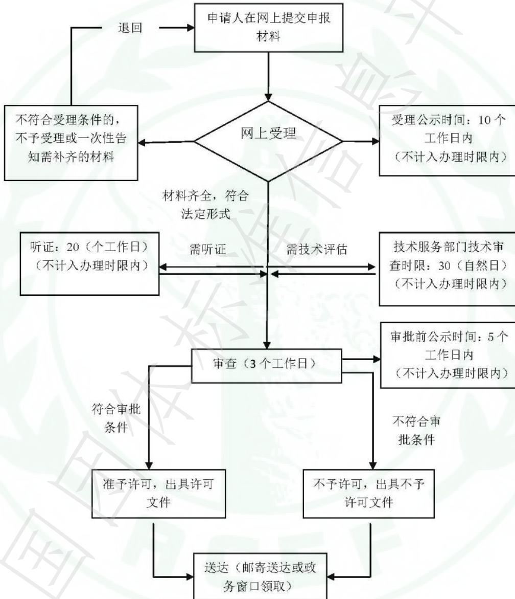
图 A.1 建设项目环境影响报告表审批流程