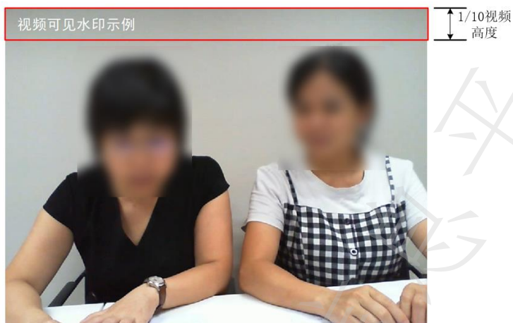
图 1 可见水印区域

视频画面主体部分应无水印或马赛克,允许添加水印的区域为视频自顶部向下至 1/10 高度范围内的所有区域,其他区域应无水印和马赛克。可见水印区域如图 1 所示。