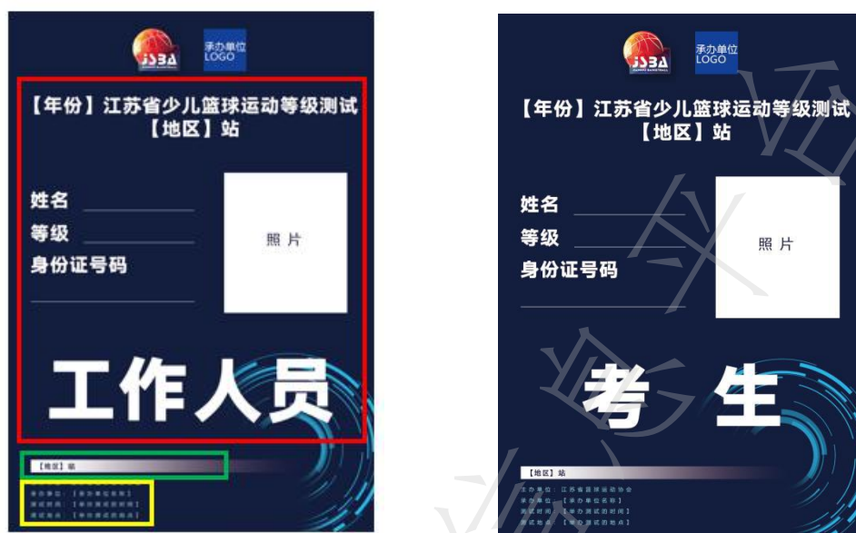
图 A.2 工作人员证、考生证