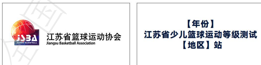
图 A.3 广告 A 字板