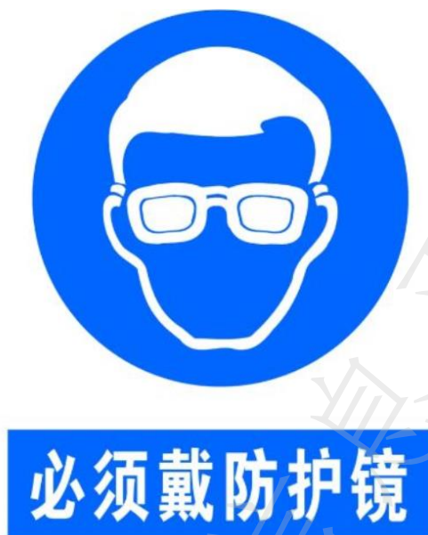
图 5 防护标记