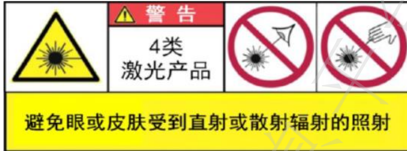
图 3 4 类激光产品警告标记