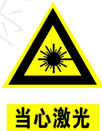
图 1 激光警示标记