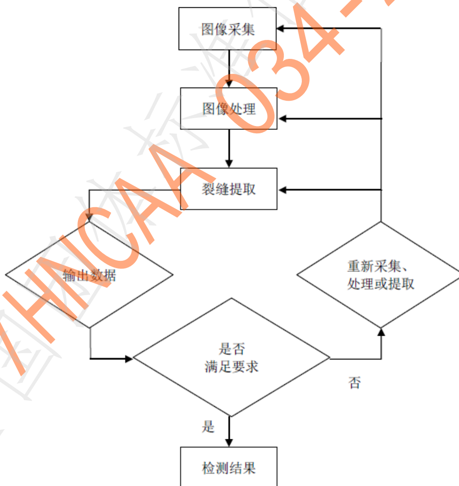
图 3.2.1 数字图像检测技术基本流程示意图

3.2.1 数字图像检测技术基本流程（图3.2.1）应包括图像采集、图像处理、裂缝提取、输出数据和检测结果。