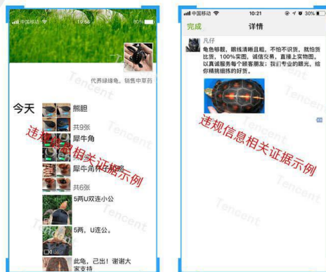
图 A.2 用户上传证据截图示例