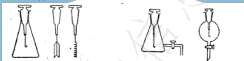
图1：燃烧瓶及铂金丝

分解完全后，吸收液完全转移到滴定用三角烧瓶中，另加 30 mL 蒸馏水冲洗燃烧瓶内壁，同样转移至三角烧瓶中，先加入几滴酚酞指示剂（A.3.1），用稀氢氧化钠溶液（A.3.4）调至微红色，再滴加适量茜素红指示剂（A.3.2），并用稀盐酸溶液（A.3.5）调样品由红色变为淡黄色，加入 4 mL 氯乙酸钠缓冲溶液（A.3.3），摇匀待用。