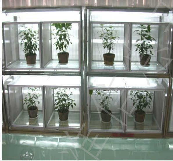
图 D.1 瓢虫繁育箱