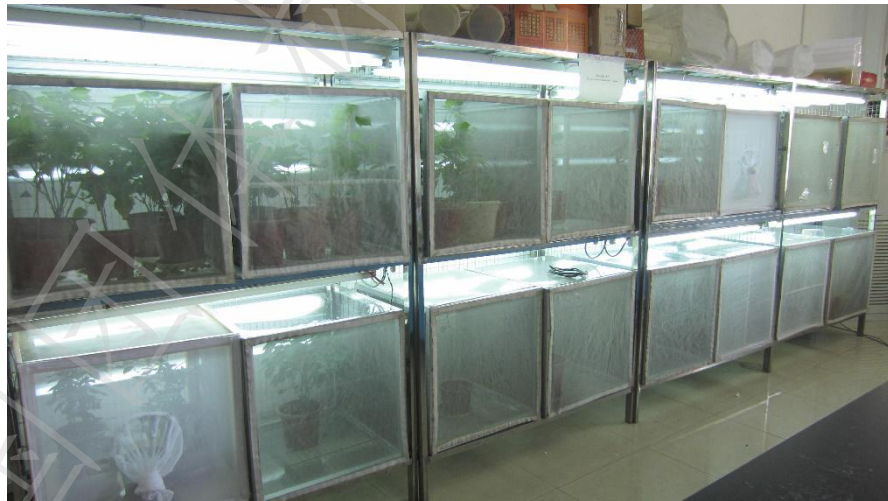
图 D.2 瓢虫繁育架