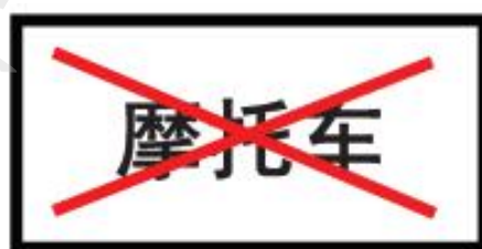
图4 B3 类型限制使用标志

7.1.2 外包装包含信息应有产品名称、规格型号、厂名、厂址、联系方式、标准编号、产品许可或认证标志，上述信息也可以电子的方式提供，但应保证易于获取。