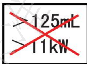
图3 A3 类型限制使用标志