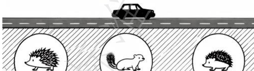
图2 生态涵洞示意图