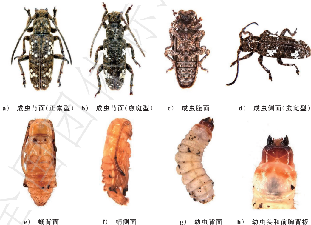
图 A.1 瓜藤天牛形态特征图

体长8 mm~12 mm,宽2.5 mm~4.5 mm,体圆筒形,茶褐至黑褐色,体表密生棕黄色短绒毛,分布不均匀。触角为体长的一半,共11节,第1节最粗;第2节较细,近球形;第5节~11节均较短,合计为全长2/5。前胸背板正中有小白斑组成的花纹,中间宽,两端稍窄,中部向后延伸为1直纹。鞘翅上刻点粗而浅,排成整齐纵行。两鞘翅上各有由小白斑点并合而成的不规则大斑2个,白斑排列成基半部半圆形和端半部三角形点斑团,有时点斑呈靠近的分离状态(正常型),有时候点斑互相连接成短直线(愈斑型)[见图A.1 a)~d)]。鞘末有1个~4个白色小斑,略成横行。鞘翅上还散生许多不明显小斑点。腹部黑色,各节有小白斑2枚,纵排成V形虚线,小白斑的两侧各有小黑斑1个。