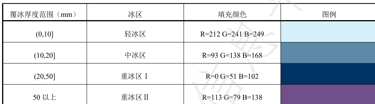
表 C.2 输电线路图例