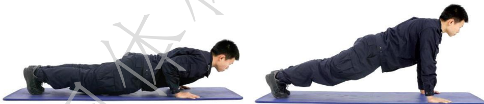
图A.2 a) 正确动作示范