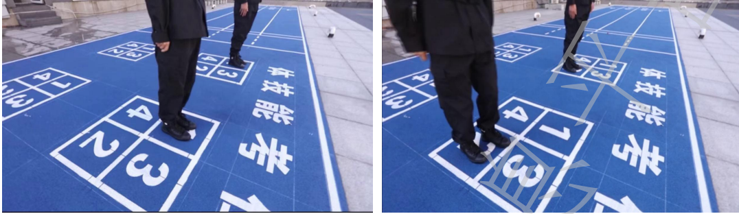
图A.5 田字格规范动作示范