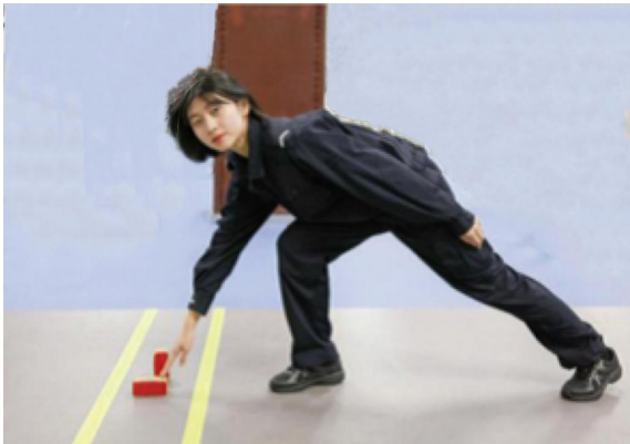
图 A.1 a) 正确动作示范