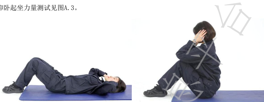
图A. 3 a) 正确动作示范