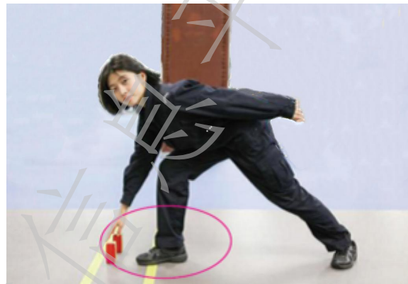
图A.1 b) 错误动作示范