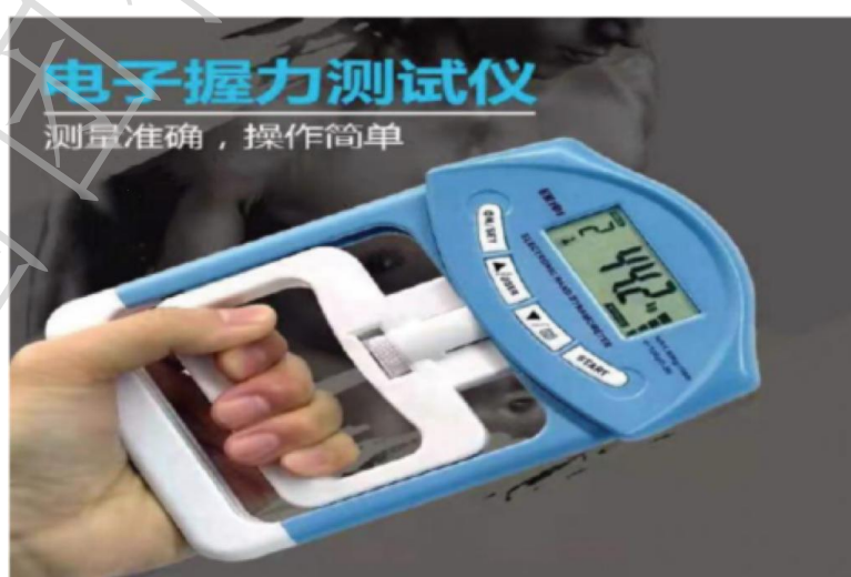
图A. 4 电子握力测试仪规范动作示范