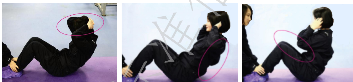
图A. 3 b) 错误动作示范