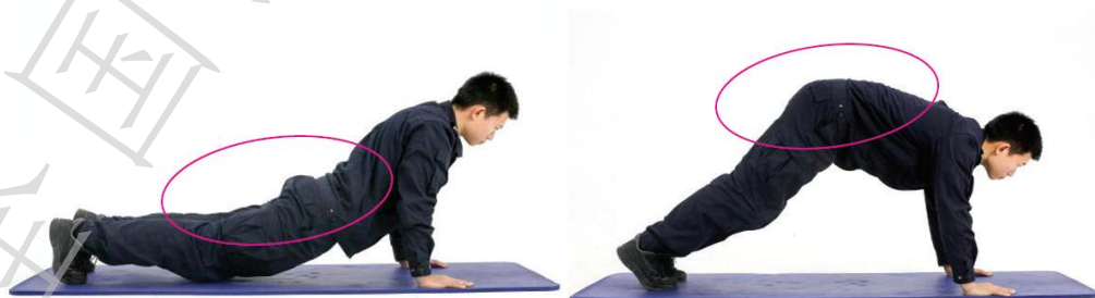
图A.2 b) 错误动作示范