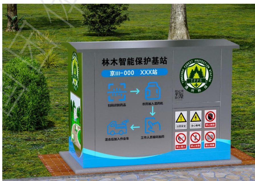
图A.3 三级站外观示意图