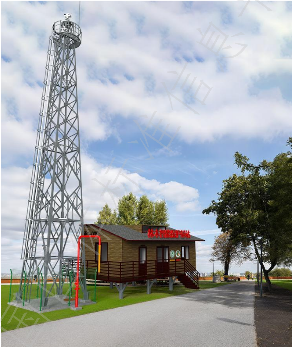
图A. 1 一级站外观示意图