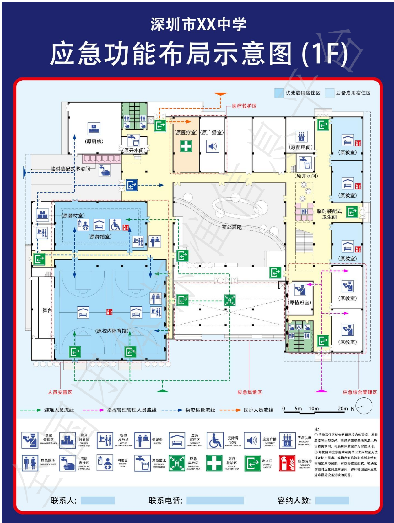
图C.2 校园避难建筑的应急功能布局示意图