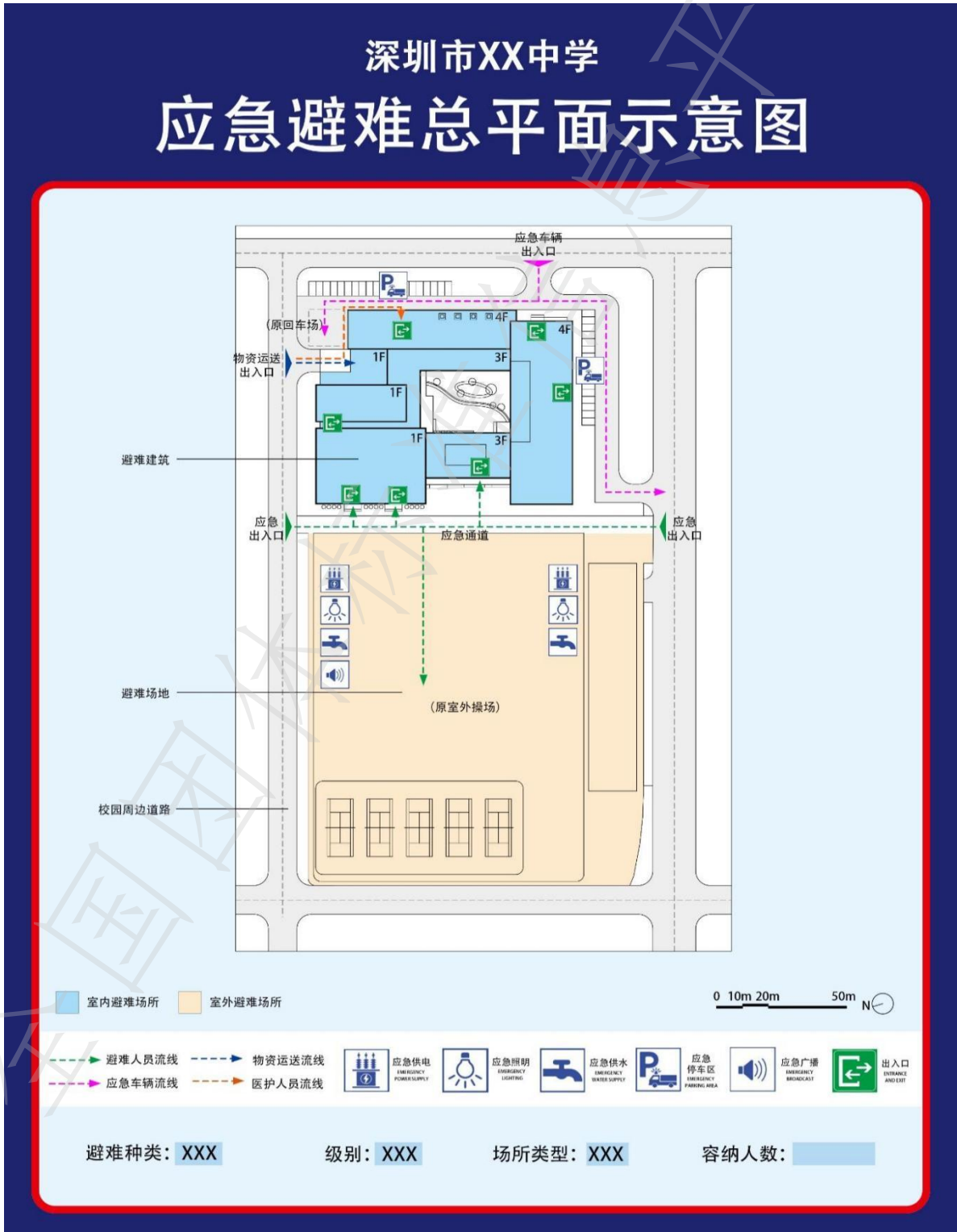
图C.1 校园应急避难总平面示意图