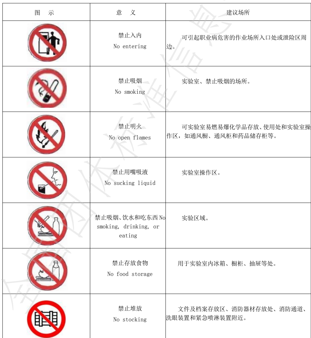
表 1 禁止标识