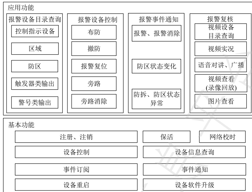
图 2 报警联网协议功能组成示意图