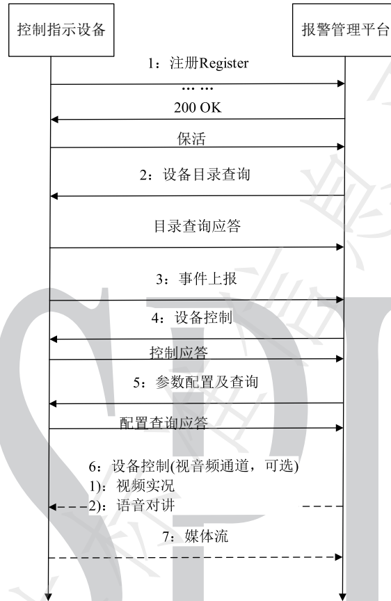
图 3 通讯双方交互过程示意

控制指示设备与报警管理平台通信基于 GB/T 28181-2022 协议并进行相应扩展，流程应符合图 3 规定。