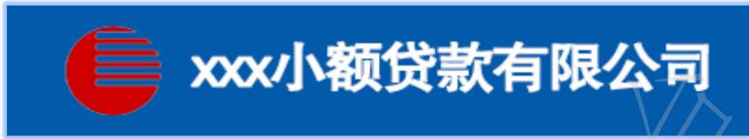
图 1 营业场所统一标识示例图