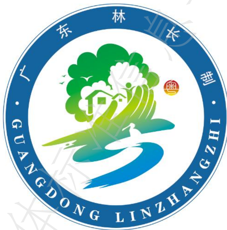
图 A.1 广东林长制 LOGO