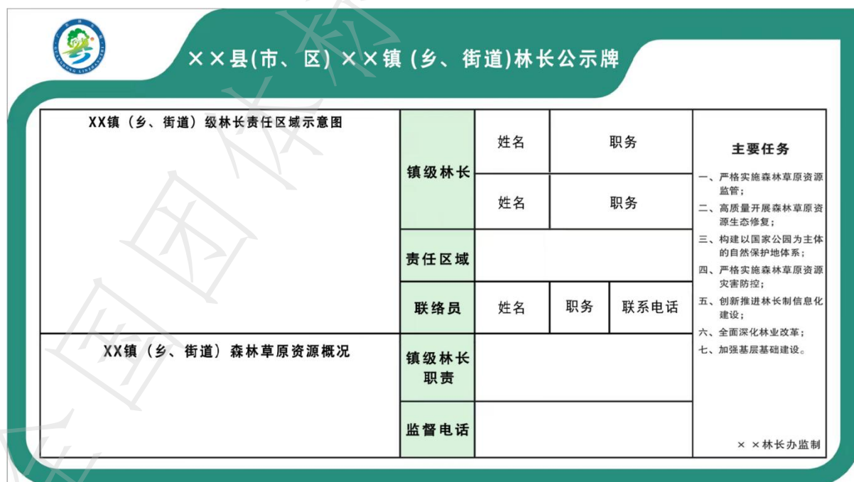
图 B.4 镇林长公示牌版面图