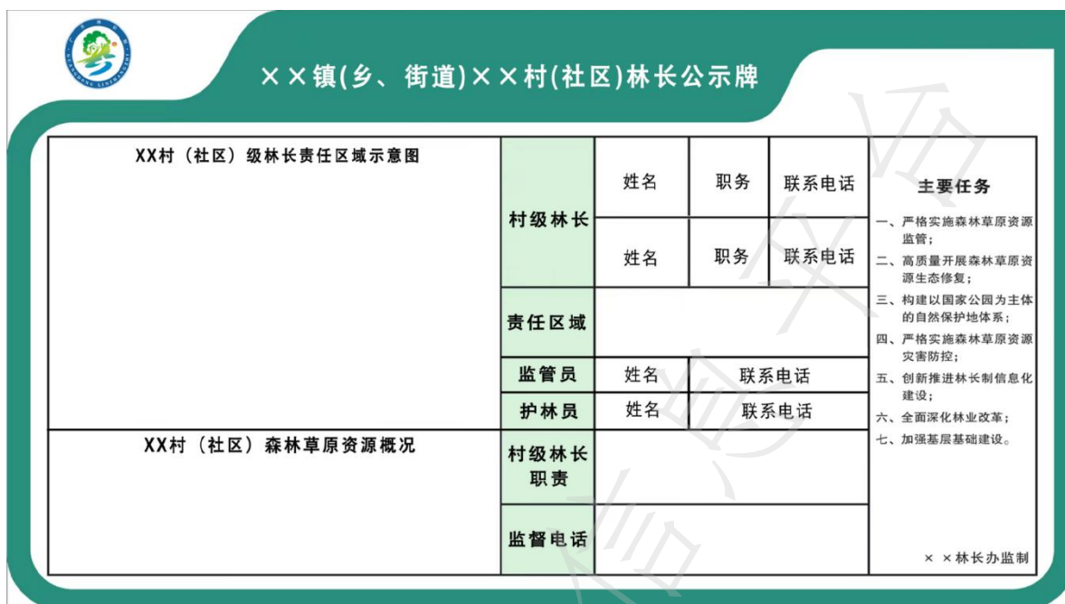
图 B.5 村林长公示牌版面图