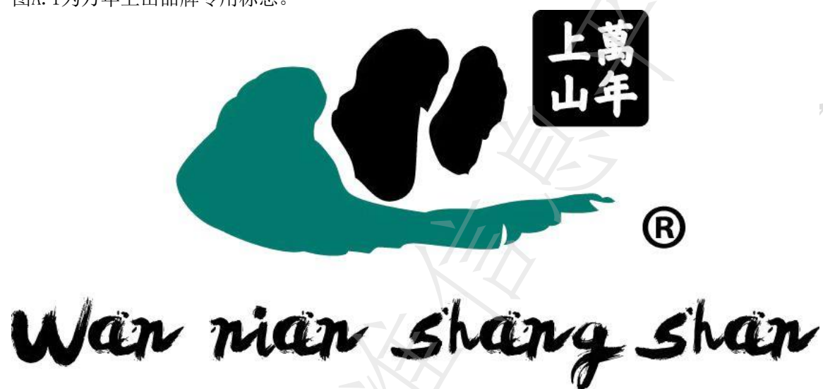
图A.1 万年上山品牌专用标志