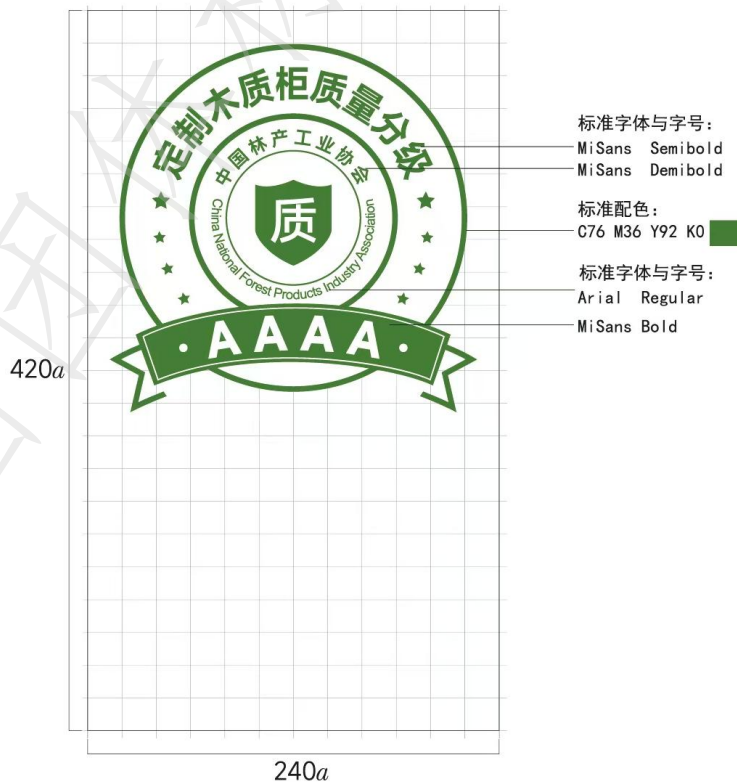
图A.3 定制木质柜AAAA级格式及色值示例