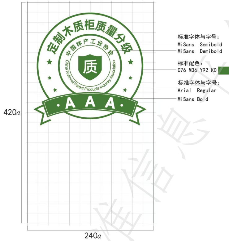
图A.4 定制木质柜AAA级格式及色值示例