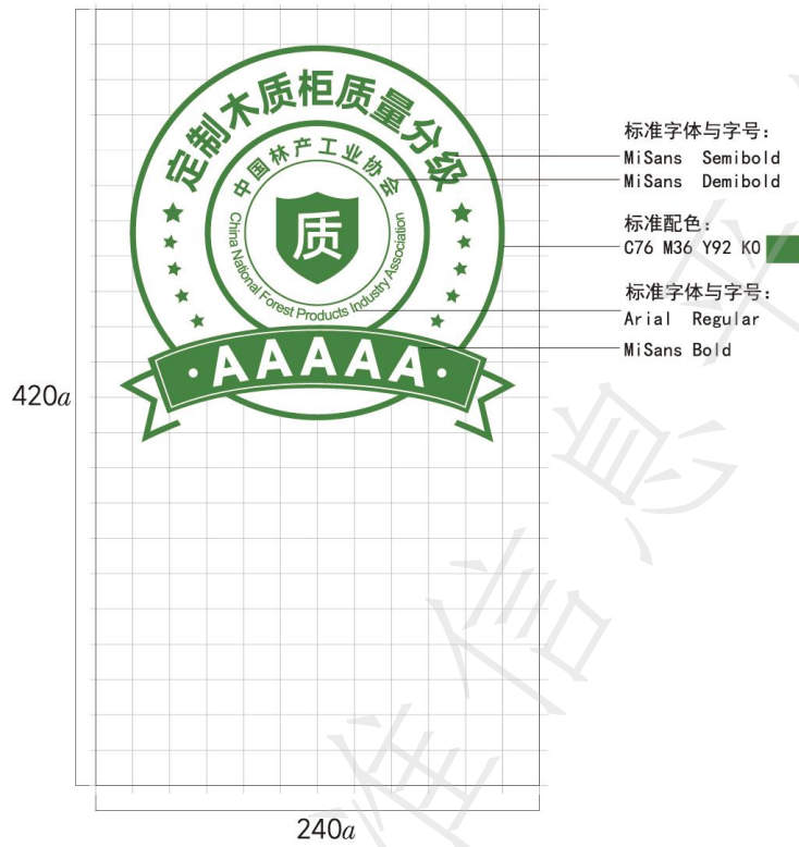
图A.2 定制木质柜AAAAA级格式及色值示例