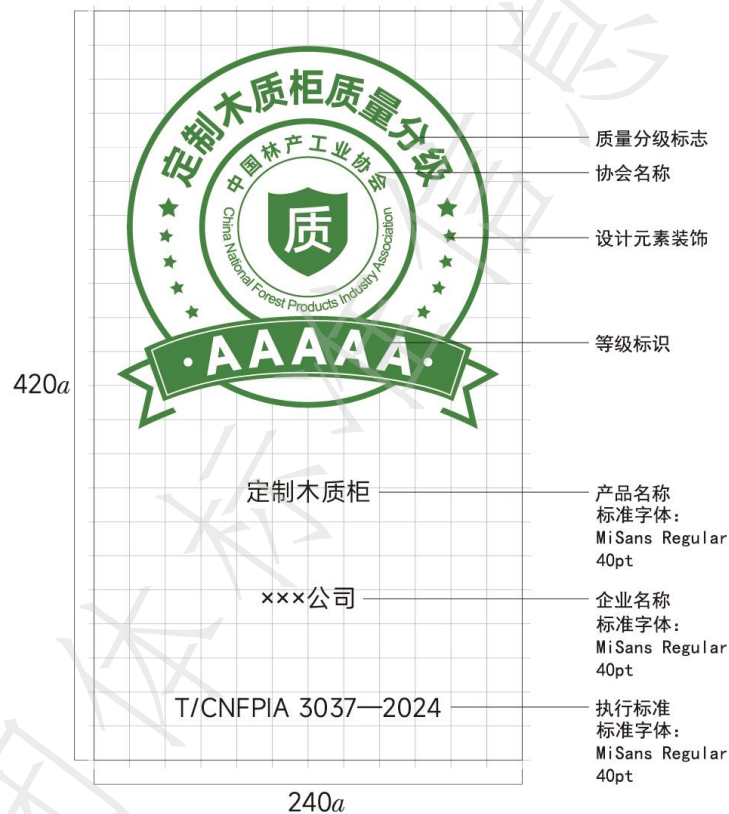
图A.1 定制木质柜质量分级标识内容及格式