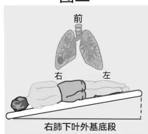
右肺下叶外基底段