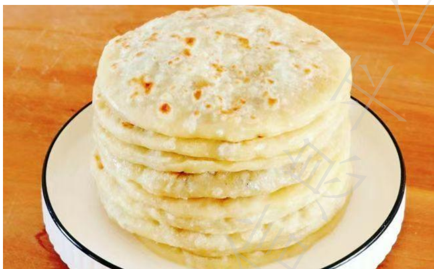
图1 内蒙古地理标志美食名菜 科尔沁蒙古馅饼装盘效果