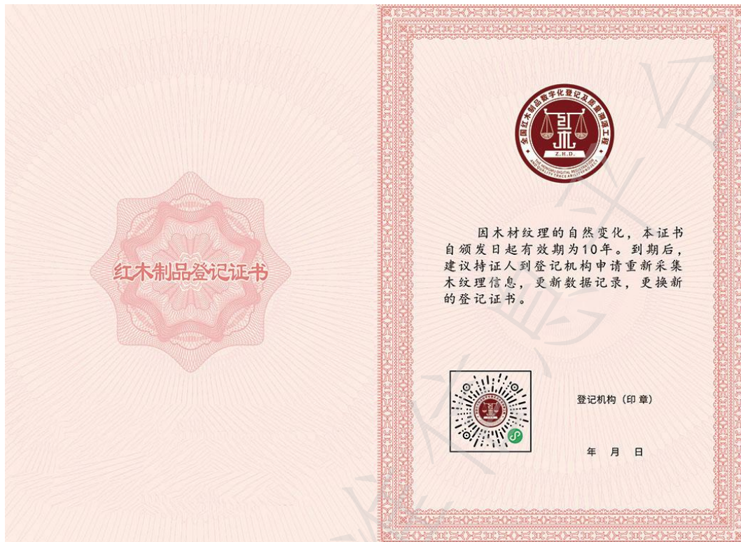
图 B.2 证书内页第一页和第二页