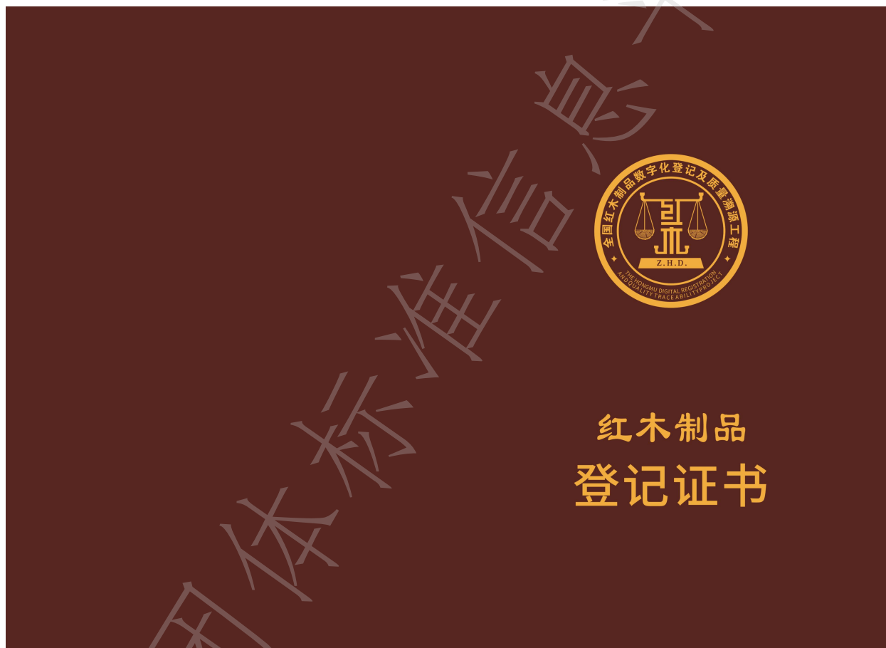
图 B.1 证书的封皮和封底