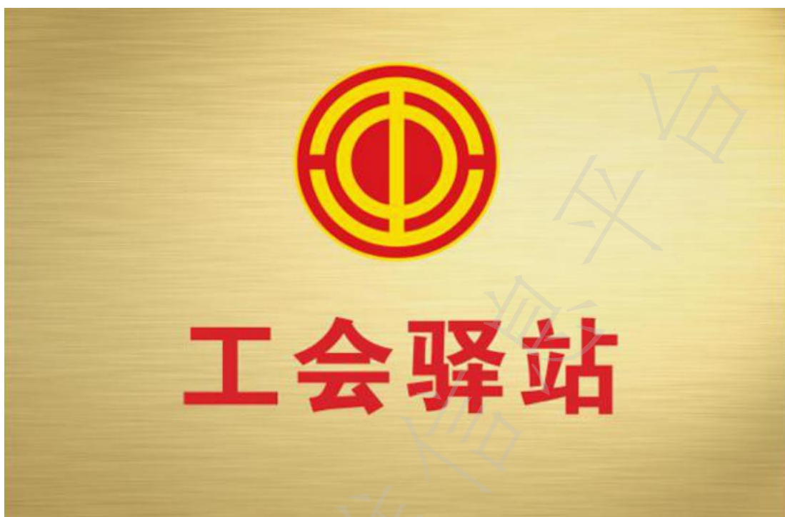
图 A.2 铜质牌匾示意图