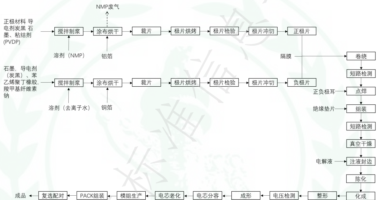
图A.1 锂离子电池制造行业典型生产工艺流程及NMP废气产生节点