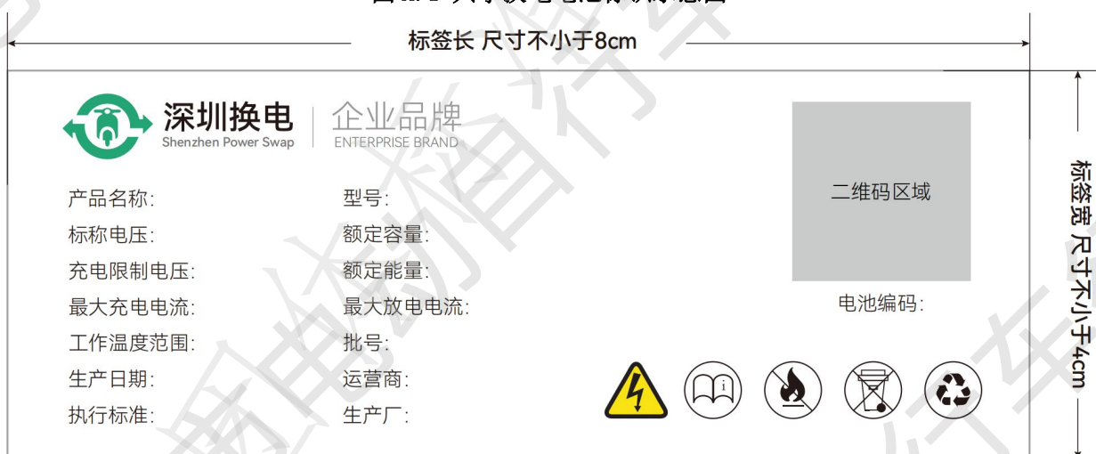
图 A.1 共享换电电池标识示意图