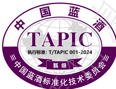
图 2 中国蓝酒标志示例