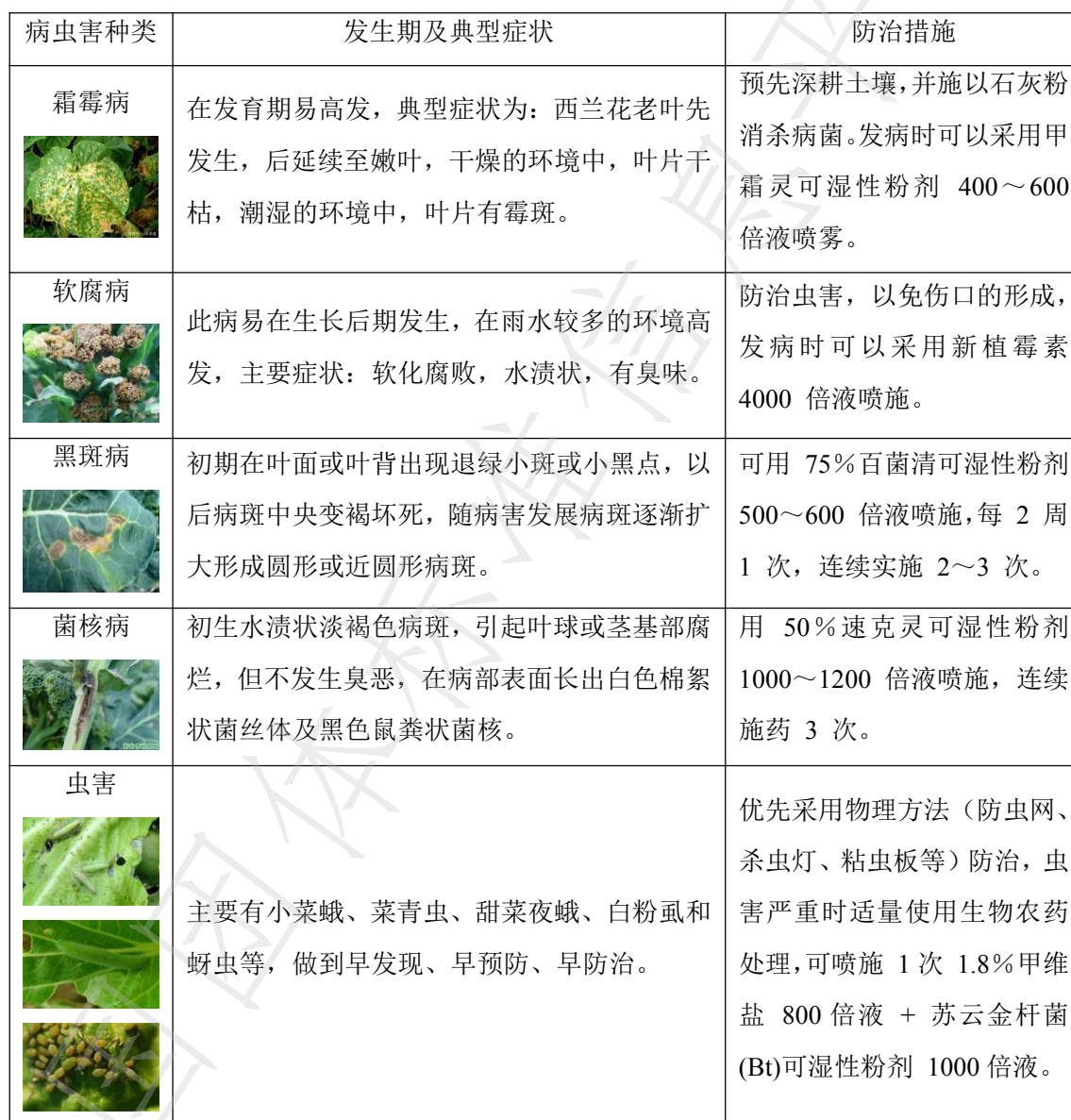
表 A 楚雄西兰花主要病虫害药剂防控技术措施