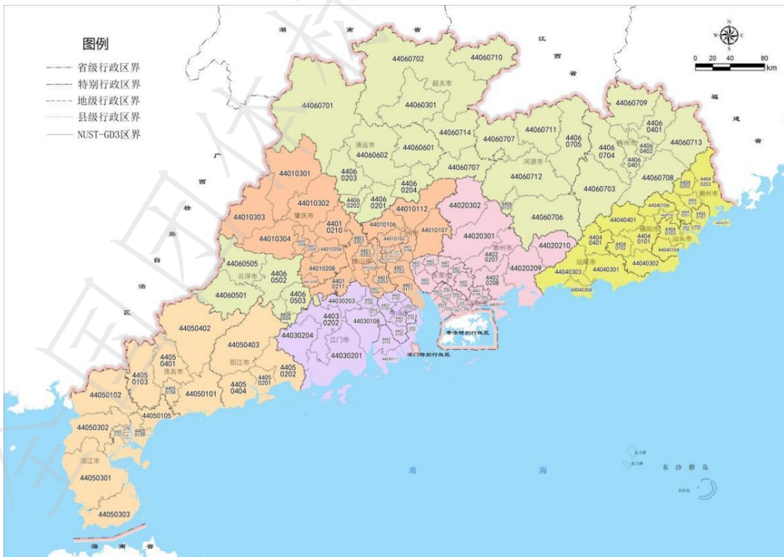
图A.3 广东省域空间治理 III 级单元 (SUSG-GD3) 划分示意图