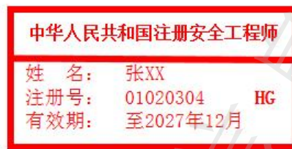
图 B.2 注册安全工程师执业印章模型图 (示例)